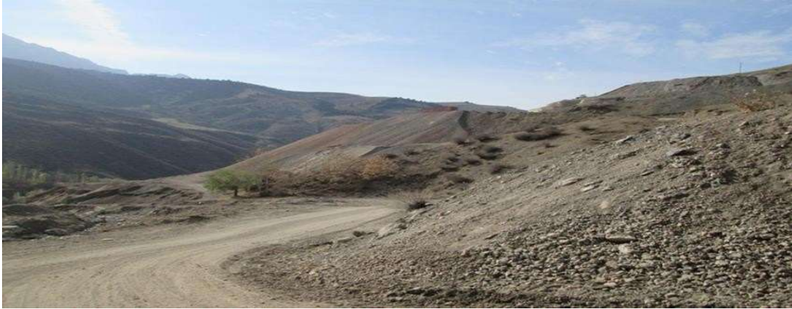
4-сүрөт. Чилтанда топтолгон күйгөн калдык

Толубай тоо кыркасында жайгашкан Рудниктеги ККты жана Чилтан айылында жайгашкан ККты изилдедик. ГОСТ 17.2.3.01-86 НД боюнча тандоожүргүзүлдү. Консервациялоо усулу болгон жок (3, 4-сүрөттөр).