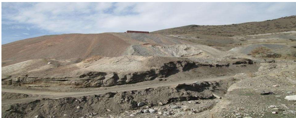
3-сүрөт. Чаувай заводунун жанындагы күйгөн калдык (огарки).

Бул күйгөн калдыктардын жайгашкан жерине калктын турак жайлары өтө жакын. Эл жашаган жер менен аралыгы 3 км араң чыкты. Эл чарбачылык иштерине колдонгон суу анын оң жагынан өтөт. Жандыктар ушул суудан ичкендиктен бул сууну да изилдөө максатка ылайыктуу болду.