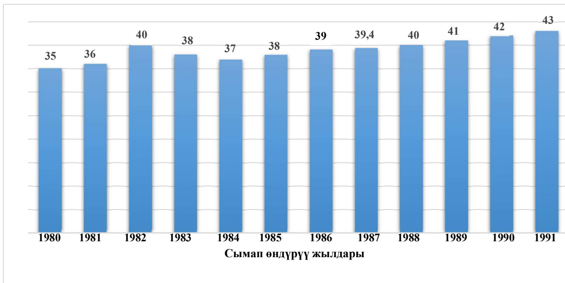
5-сүрөт. 1980-жылдан 1991-жылга чейин өндүрүлгөн сымаптын динамикасы.

СССР мезгилинде Чаувай шаар тибиндеги айылда иштегенишканалардын ичинен сымапты бөлүп алуучу завод айына 3,5-4 тонна сымап өндүрүп турган. Завод иштеп чыккан чыгындыларды ачык асман астына таштоо, техникалык түзүлүштөрдүн жөнөкөй жана төмөнкү деңгээлде болгондугуна байланыштуу күйгөн калдыктардын (огаркинин) курамында оорметаллдар толук алынбай калган [16].