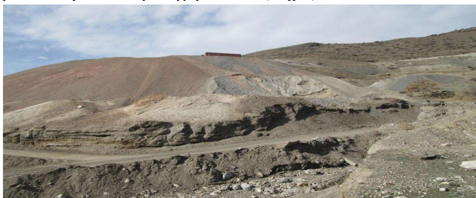
6-сүрөт. Күйгөн калдыктар менен суунун ортосундагы автомобиль жолу суунун, топурактын, абанын, өсүмдүктөрдүн курамындагы сыматтын санын аныктоого.

Кен массивинин калдыктары Чаувай айылынын Борду тоо кыркасынын түштүк капталында 78 жыл ичинде топтолгон. Ал мурдагы иштеп, азыркы күндө ишин токтоткон заводдун жанында жана андан 3,7 км төмөндө КК формасында топтолгон. КК менен эл жашаган жердин аралыгы чыгыш жагынан 2,6 км, түштүгүнөн 3 км, батышынан 1 км ди түзөт. ККдын көлөмү гигант көлөмдө. Анын үстүнө 1995-жылдын 27-августунан баштап завод калдык төкпөй калган. Азыркы күнгө чейин ККдын үстүндө чөп өскөн эмес. ККтын жана ташталган пароданын түштүгүнөн 1,3 км аралыктан Чаувай суусу агып өтөт (6-сүрөт).