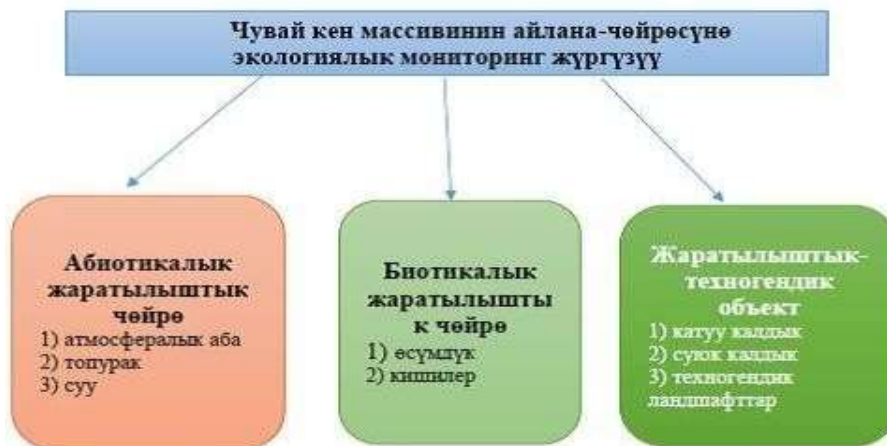
2-сүрөт. Чаувай кен массивинин калдыктарынын айлана-чөйрөгө тийгизген таасирин изилдөөнү жана мониторинг өткөрүүнүн схемасы.

Бул күйгөн калдыктардын жайгашкан жерине калктын турак жайлары өтө жакын. Эл жашаган жер менен аралыгы 3 км араң чыкты. Эл чарбачылык иштерине колдонгон суу анын оң жагынан өтөт. Жандыктар ушул суудан ичкендиктен бул сууну да изилдөө максатка ылайыктуу болду.