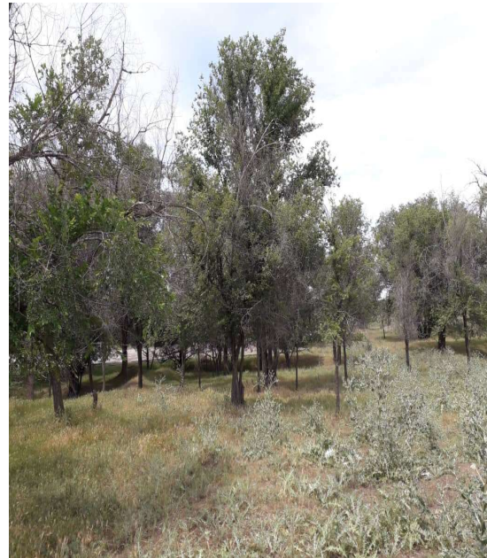
1-сүрөт. Пригородное айылындагы каражыгачтардын сырткы көрүнүшү.

сырткары тиричилик калдыктары, мал жайуу жана механикалык аракеттер терс таасирин тийгизери анык. Изилдөө учурунда бул аймактын каражыгачтарынын жаштык курагында жетилген жана картайып бара жаткан дарактар басымдуулук кылды. Алардын ичинен механикалык жабыркаган дарактардын да саны жогору жана куураган бутактары көп дарактар көп кездешти (1-сүрөт).