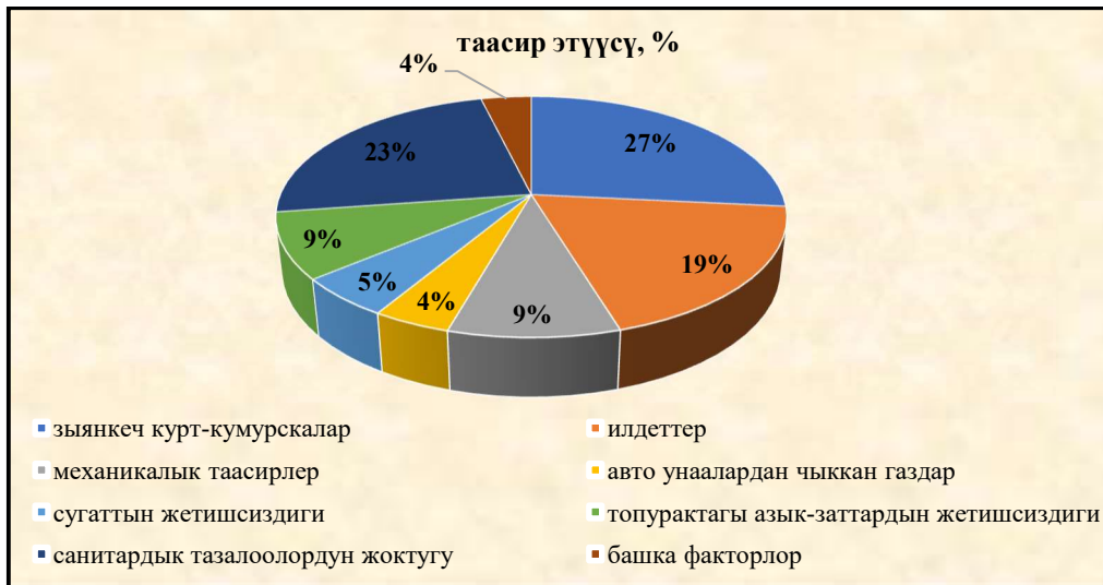
1-диаграмма. Экологиялык факторлордун каражыгач дарактарына тийгизген таасири.

Жалпысынан бул дарактардын чыдамкайлыгын жана өзүн-өзү калыбына келтирүү жөндөмүн эске алып санитардык абалы орточо канааттандыраарлык деп бааланды. Ал эми өз убагында санитардык тазалоо иштеринин жоктугунан жана механикалык жабыркоолорго көп учурагандыктан, каражыгач жалбырак оюгучтары менен массалык жабыркагандыктан бул дарактардын декоративдик абалы ортодон төмөн шкаласы менен бааланды.