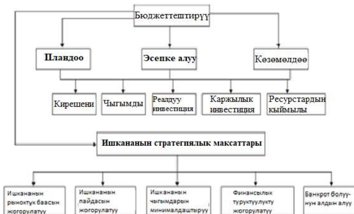
2-сүрөт. Бюджеттештирүү процессинин этаптары.

Ишканада бюджеттештирүү процесси негизги 3 этаптан: пландоо, эсепке алуу жана көзөмөлдөөдөн турат, алар ишкананын стратегиялык максаттарына (ишкананын чыгымдарын азайтуу, кирешесин көбөйтүү, рыноктук баасын жана финансылык туруктуулугун жогорулатуу) жетүүгө багытталат (2-сүрөт).