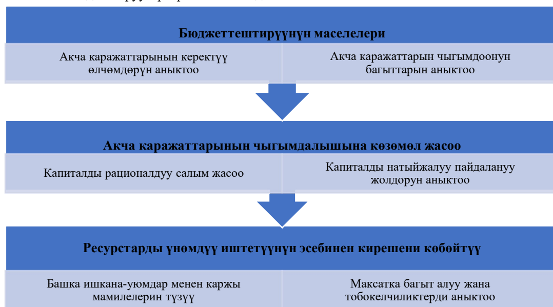
1-сүрөт. Бюджеттештирүүнүн негизги маселелери.

Бюджеттештирүүнүн түрүнө карабастан, анын максаты ишкананын ишмердүүлүгүн ресурстар менен үзгүлтүксүз камсыз кылуу болуп саналат, ал үчүн чарбалык операцияларды пландаштыруу, бардык бөлүмдөрдүн ишин жана алардын өз ара аракеттешүүсүн жөндөө, кызматкерлерди натыйжалуулукту жогорулатууга шыктандыруу талап кылынат [2]. Бюджеттештирүү ишкананын каржы ресурстарын туура пландоо жана натыйжалуу пайдаланылышын көзөмөлдөө, каржы мамилелерин түзүү, кирешени көбөйтүү маселелерин чечет. Бюджеттештирүүнүн негизги маселелери схема түрүндө 1-сүрөттө чагылдырылды.