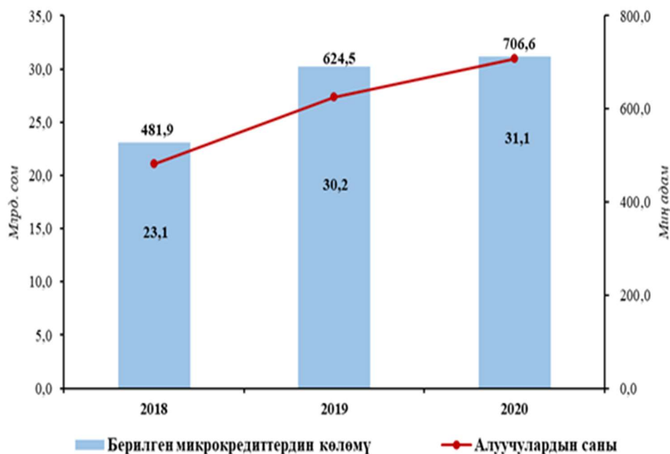
1-сүрөт. Кыргыз Республикасында 2018-2020-жж. микронасыялардын берилиши.