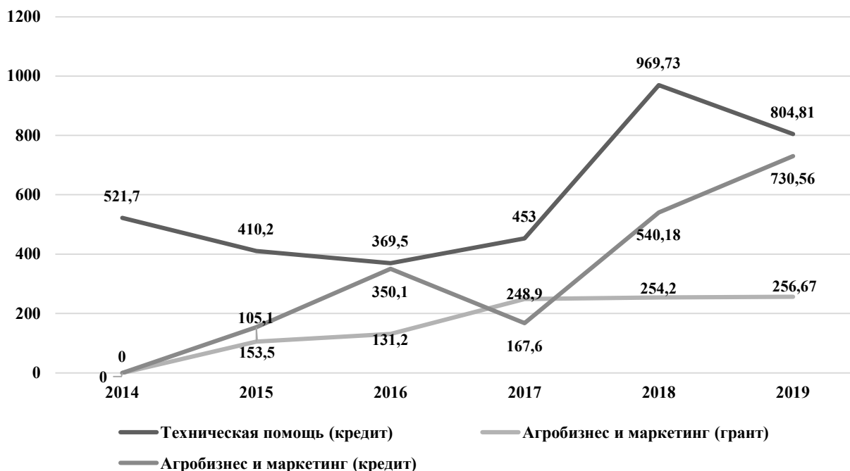
Рис. 1. Показатели инвестиционных проектов по сельскому хозяйству Кыргызской Республики за 2013-2019 годы.

ционного финансирования считаются все виды функции хозяйственной деятельности, прибыль после оплаты налогов, рентных платежей и дивидендов что, в полном объеме могут быть использованы в виде вклада в собственное производство предприятиями и предпринимателями.