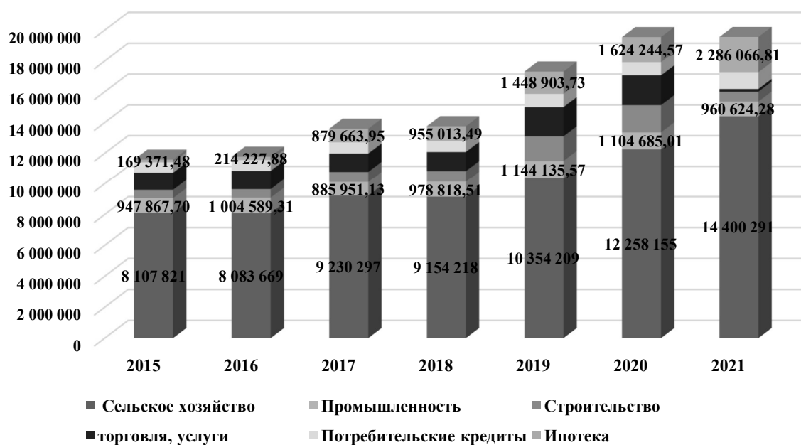
Рис. 3. Основные отрасли, финансируемые Айыл Банком за 2015-2021 гг.

Самый большой удельный вес кредитования приходится на Чуйскую, Жалал-Абадскую и Ошскую область. Региональная сеть ОАО «Айыл Банк» одна из самых больших в стране, и это один из важных факторов, которые дают преимущества регионального присутствия и доступности среди функционирующих банков и охватывает все регионы Кыргызстана: 32 филиала, 64 сберегательных кассы и 30 выездных касс, 19 кредитных подразделений в районах и 31 кредитное подразделение в отдаленных селах.